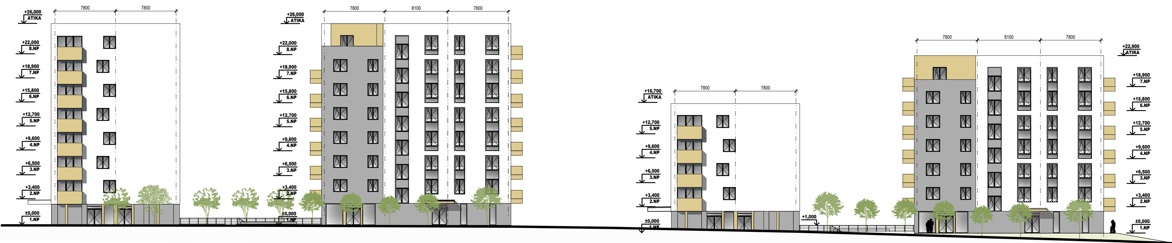
USKAKOVANÁ SEKCIA POHĽAD ZÁPADNÝ - BLOK E ±0,000=286,250 m n.m.